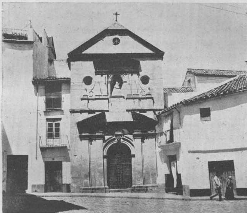
(Fig. 7.) Hospital de la Santísima Trinidad. Hoy Ermita del Socorro

FUNDACIÓN.—Muy antigua es, a no dudarlo, la fundación de este hospital. Los primeros datos conocidos alcanzan el año 1319, en que Inés de Este-