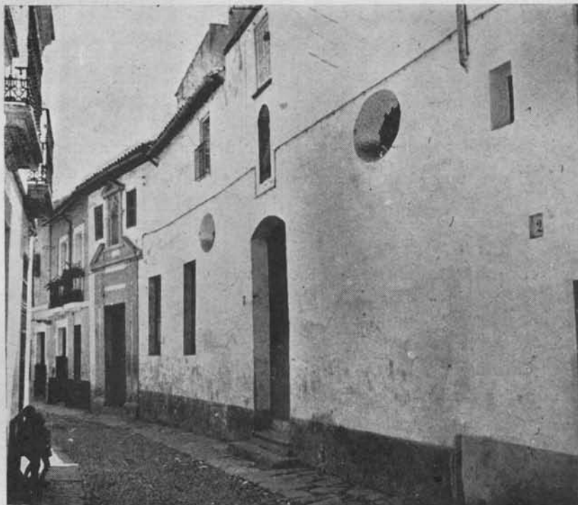
(Fig. 10.) Hospital de Nuestra Señora de la Candelaria. En primer término Portada de la Iglesia. No pudo tomarse la espadaña en la fotografía por la estrechez de la calle. Segundo término, Puerta del Hospital.

Esta cofradía se dió a sí misma unas reglas en 1487, en cuyo capítulo XX se