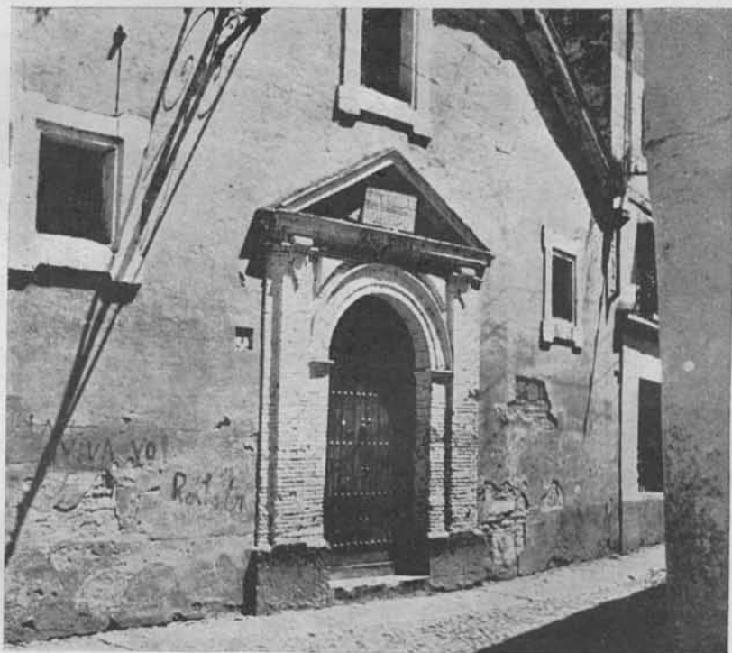
(Fig. 9.) Hospital de Nuestra Señora de la Consolación. Hoy «Escuelas del Excmo. Sr. Obispo». La Portada de la fotografía es la de la primitiva Iglesia

ni trocar ni enagenar en ninguna manera que sea y de la renta della el dho mi hermano y sus herederos después de su vida del y después de mi finamiento den e paguen de cada año para la iglesia de Sta. María de Consolación que es cerca de la guerta de San Franc o docientos maravedís de esta moneda que se