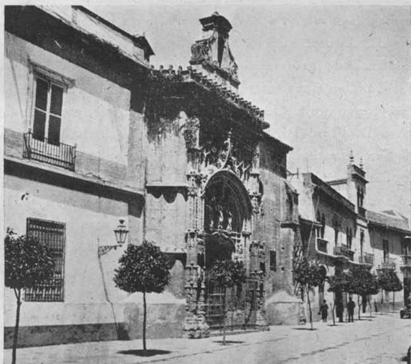
(Fig. 5.) Portada de la Iglesia del Hospital de San Sebastián, en su Segundo Emplazamiento. Hoy Casa Central de Expósitos.

Así pues, el día 13 de Febrero de 1512 resolvió definitivamente el Cabildo