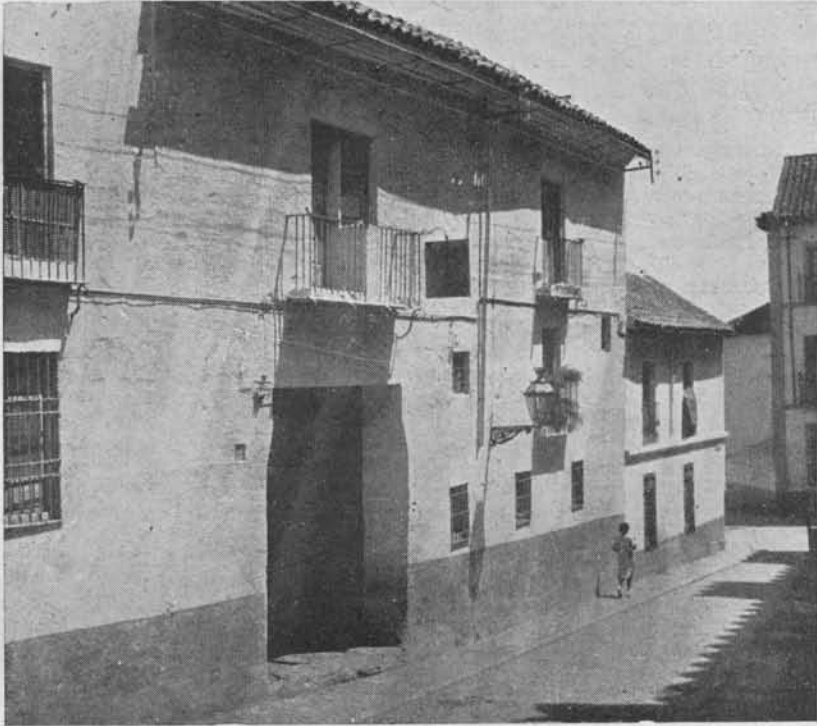
(Fig 3.) Primer Emplazamiento del Hospital de San Sebastián. Hoy Posada del Sol

loca este Hospital cronológicamente en el siglo XIII por la afirmación rotunda de Borja Pavón, según el cual, «inmediatamente después de la reconquista, formó el Rey D. Fernando el propósito de establecer un Hospital general; y, efectivamente, llevó a cabo tan plausible pensamiento en un extenso edificio que ya