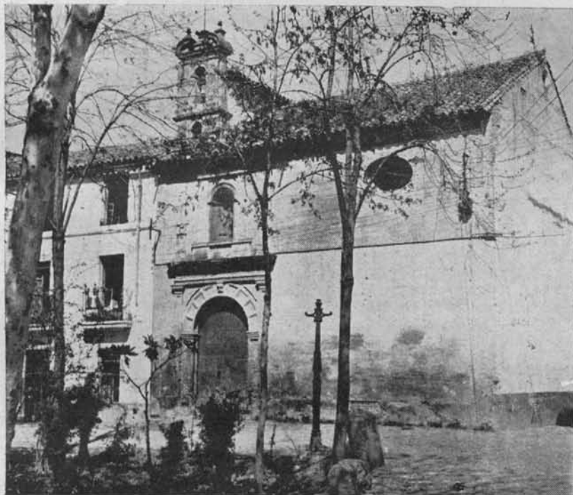
(Fig. 8.) Hospital de San José y la Magdalena. En la fotografía aparece la capilla del mismo