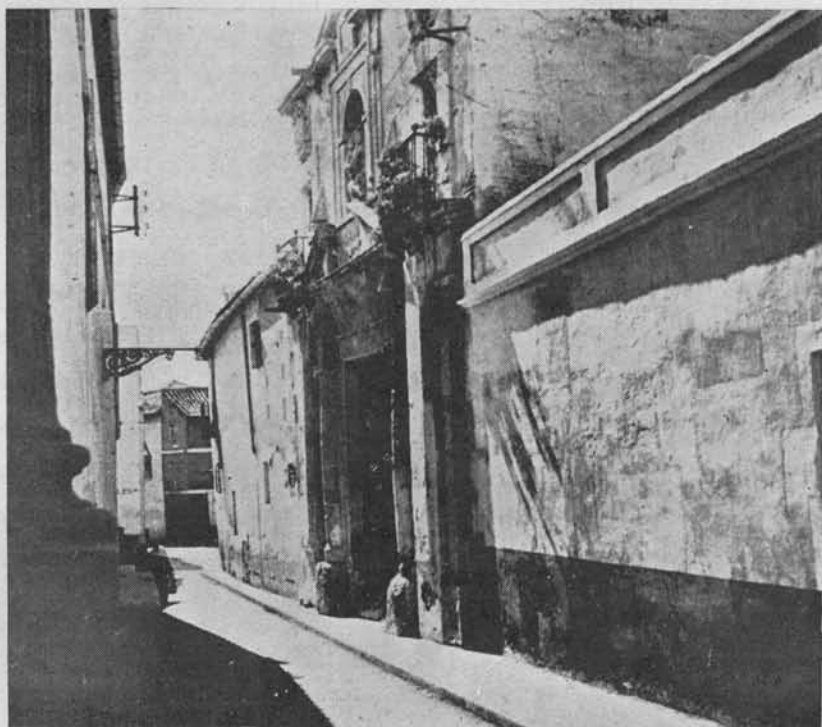
(Fig. 11.) Hospital de Santa María de los Huérfanos. La angostura de la calle no permitió la fotografía de frente con toda la altura del edificio.

FINALIDAD.—«Para que sean recibidos en el dicho hospital omes y mu-