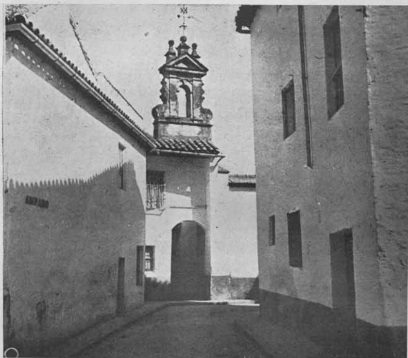
(Fig. 2). Hospital de la Lámpara. Al fondo la espadaña-campanario

3) «Y que por lo que toca a los demás débitos que se han rezeuido en data, hará el dho Administrador desde luego así judicial como extrajudicialmente