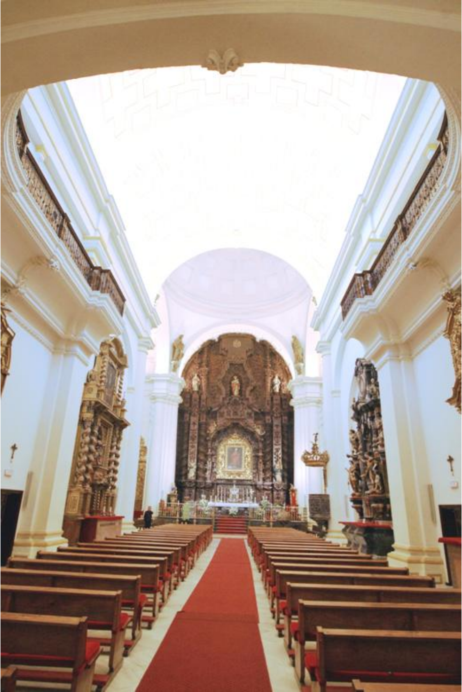
Interior del templo de la Compañía de Jesús