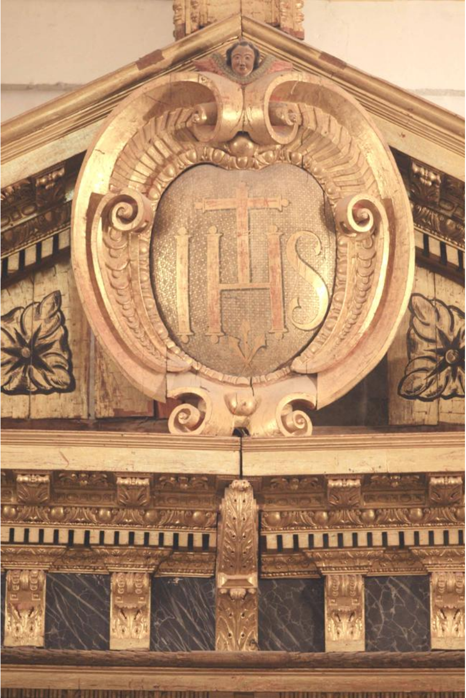
Escudo de la Compañía de Jesús en la iglesia del colegio de Santa Catalina