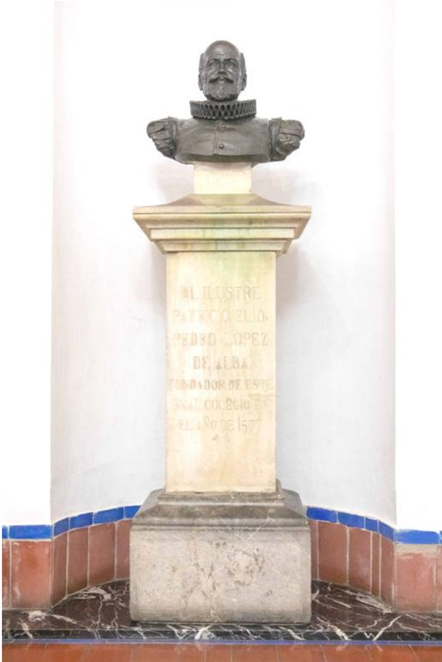
Busto del fundador del colegio de la Asunción