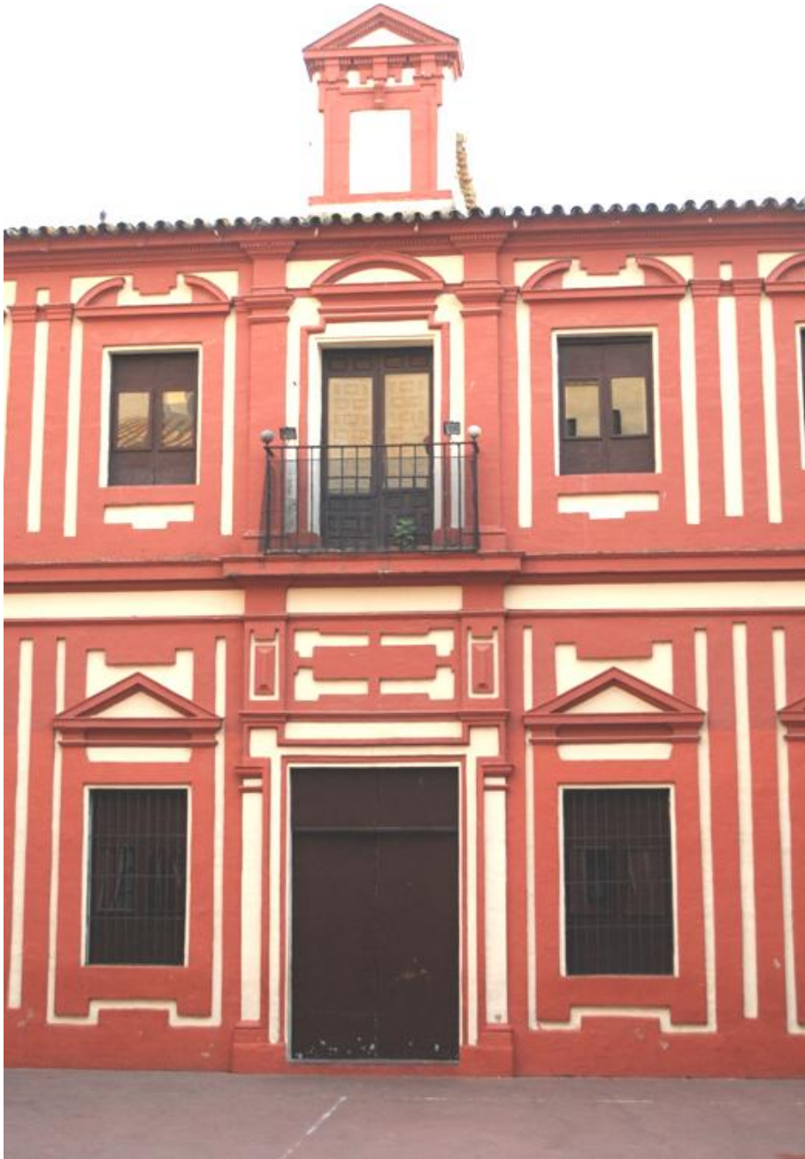
Patio del colegio de Santa Catalina