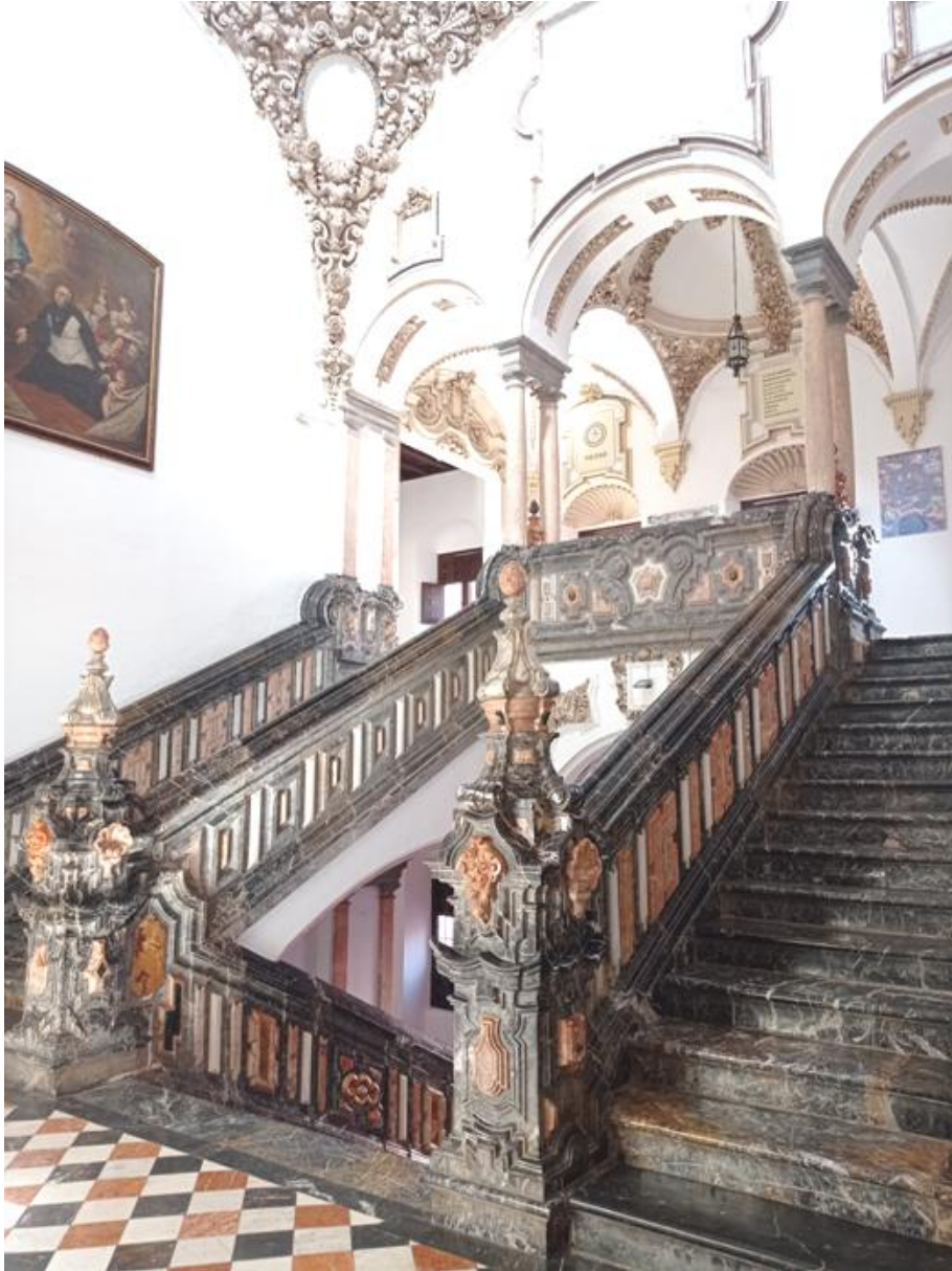
Escalera imperial del colegio de Santa Catalina