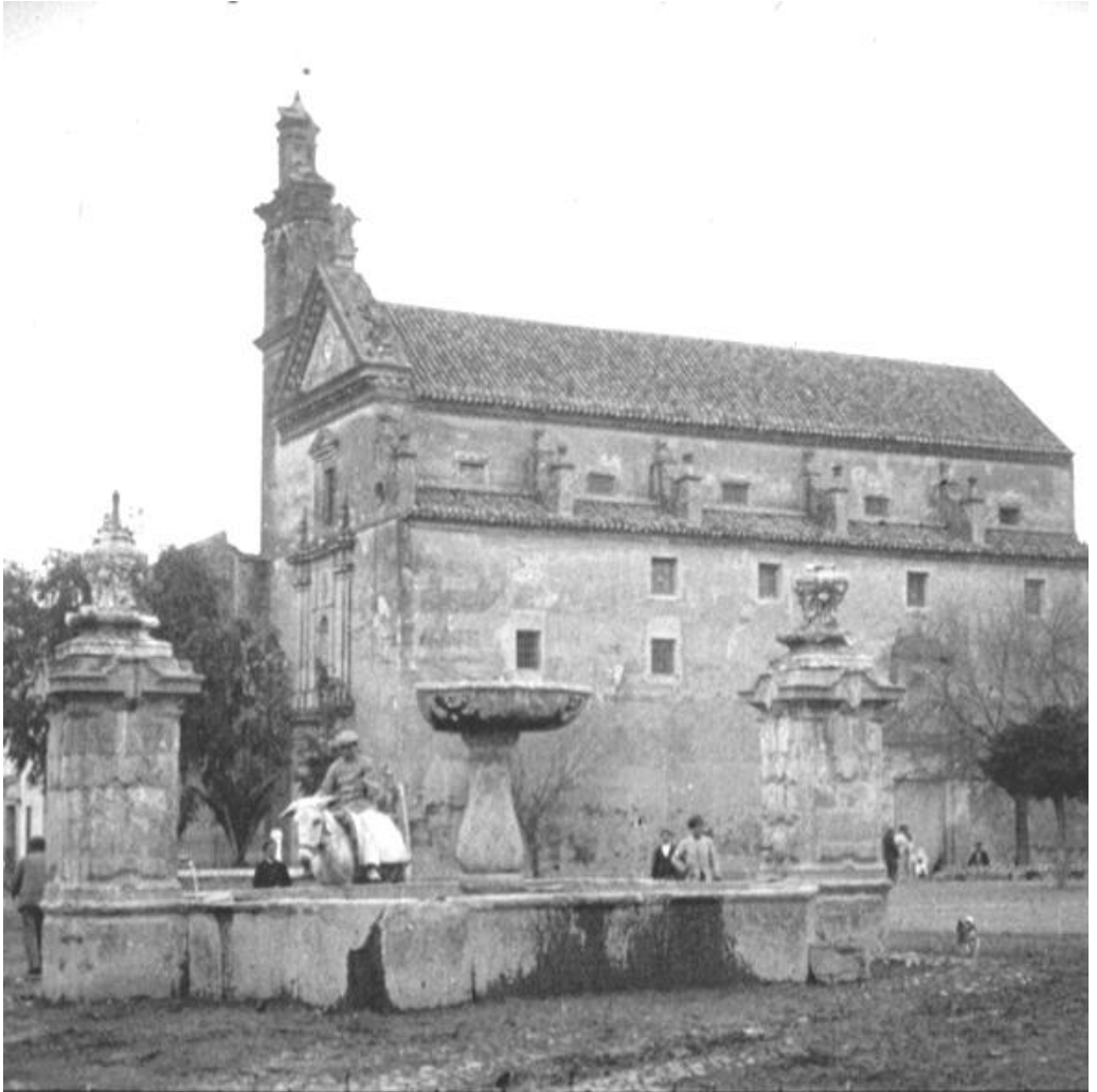
Exterior de la iglesia conventual de los terceros regulares de san Francisco (Archivo Municipal de Córdoba)