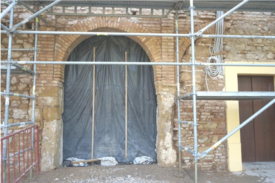
Fig. 8. Pórtico de doble arco del atrio de la iglesia

En la zona sur del alzado permanece un guardacantón biselado formado por piezas de calcarenita, que se conserva como testigo de la esquina del edificio en este momento. Este elemento está trabado con una fábrica de mampostería dispuesta en hiladas homogéneas, unas más anchas y otras más estrechas debido al mayor o menor tamaño de sus piezas, y con numerosos ripios. La culminación de este aparejo en altura coincide con el del guardacantón, y su finalidad es servir de zócalo a un alzado de tapial, que aparece trabado con una cadena de esquina apoyada sobre el guardacantón, hecha de mampostería de pequeño tamaño colocada en hiladas, y que sin duda servía para atar esta fachada con el muro que cerraba el pórtico por el sur.