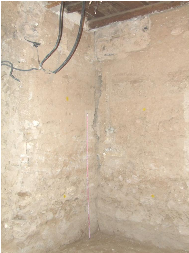
Fig. 7. Configuración de la nave lateral derecha de la ermita. Esquina interior entre los alzados oeste y sur

sostener el encofrado de madera están separadas entre 60 y 70 cm, sin elemento que los delimite. Las sucesivas reformas en el edificio han eliminado cualquier rastro del revestimiento original de este tapial, que, por comparación con otras construcciones bajomedievales halladas en el edificio, debería estar formado por una capa de no más de 3 o 4 mm de grosor hecha de mortero rico en cal con restos vegetales molidos. Se trata, pues, de un tapial muy sencillo fabricado sólo con tongadas de tierra con cal, propio de la época y del ambiente rústico en el que se ejecuta.