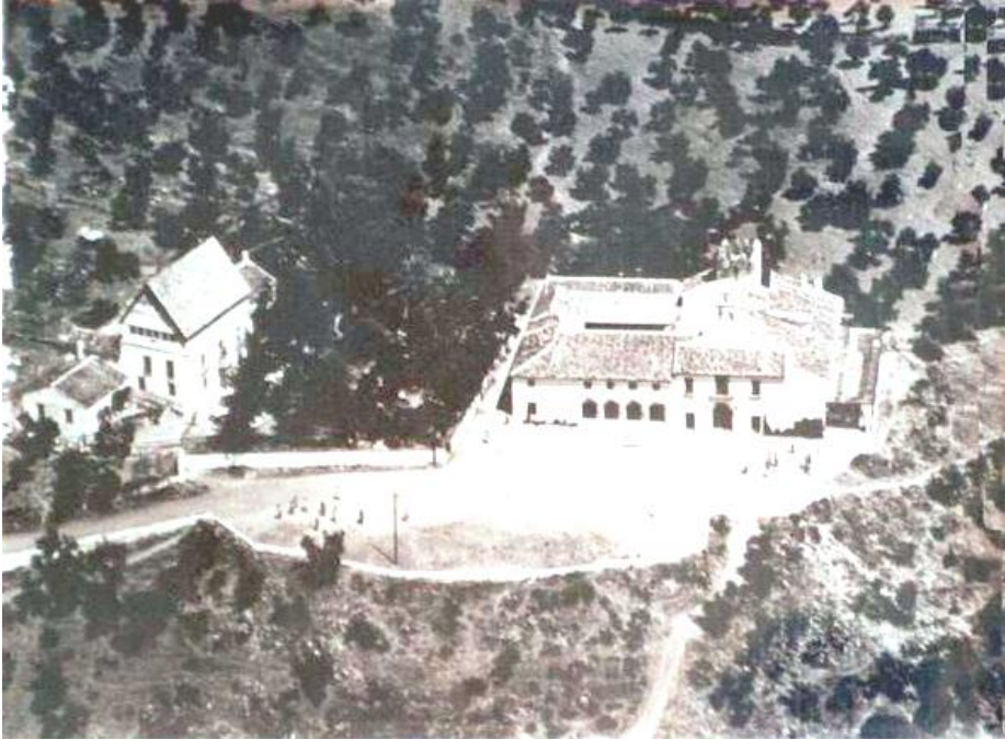
Fig. 14. Vista aérea del Santuario tras la reforma de los años 1955-1956

vanos, abriéndose ventanas en ambos muros. Los accesos de la fase anterior se siguen manteniendo (Fig. 14).