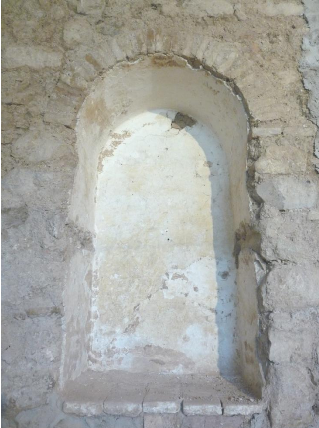
Figs. 13. Hornacina central de la fachada trasera del conjunto

Debido a la escasez de información tanto histórica como documental, se ha establecido una cronología preliminar para esta fase que engloba el siglo XVIII, incluyendo principalmente las reformas de los años 1709 a 1712 y 1721 (REDEL: 1910, 152). Se tiene constancia de que el año 1721 se ejecutó la primera gran obra que afectó al conjunto, en concreto a la casa del santero, las caballerizas y hospedería, reformándose las diferentes habitaciones.