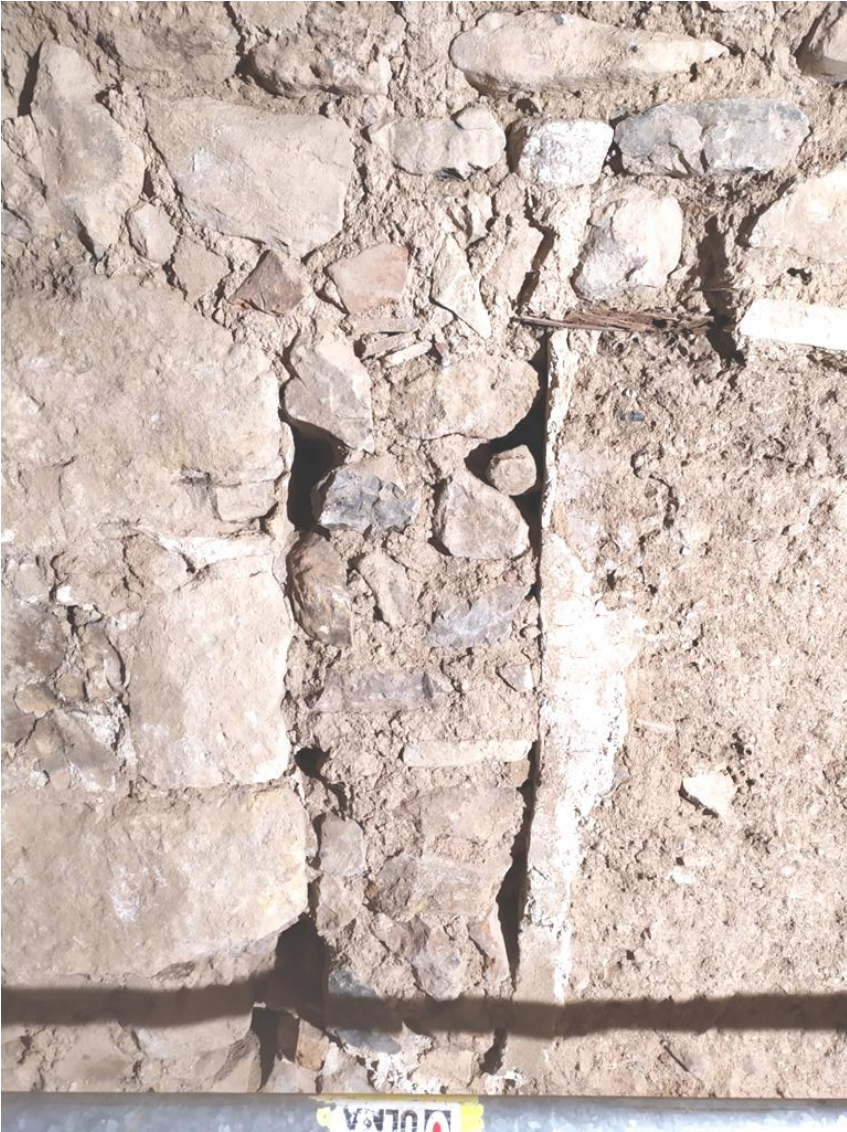
Fig. 5. Posible ventanal de la primitiva ermita

sillares que generan una línea horizontal homogénea sobre la que se apoya el alzado. A esta construcción pertenece la puerta de acceso a la ermita por medio de un vano definido en altura por un arco apuntado, y un estrecho ventanal vertical, similar a una saetera, hallado en la zona superior del muro norte de la ermita.