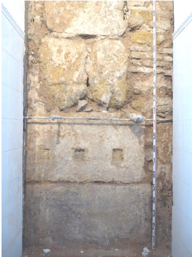
Fig. 6. Sillares reutilizados en alzado nuevo ámbito situado al norte de la nave central de la ermita

De forma coetánea, adosado al norte de la nave central de la ermita se crea un nuevo ámbito cuya funcionalidad se desconoce hasta la fecha, y al cual se accede desde el oeste a través de un vano formalizado por sillares. El alzado norte de esta nueva estancia está compuesto por sillares de gran formato y reutilizados (Fig. 6), como demuestra el pie de arbor inserto en la parte inferior del muro. Su aparejo es de sogas y tizones, y deja abierto un pequeño portillo hacia el norte. Estas estructuras conforman el espacio que posteriormente será empleado como capilla norte de la ermita. El muro este de cierre de dicho ámbito parte directamente de la torre y se prolonga en dirección N-S unos quince metros, pudiendo formar parte de un recinto fortificado erigido en esta época, o incluso preexistente y aprovechado ahora.