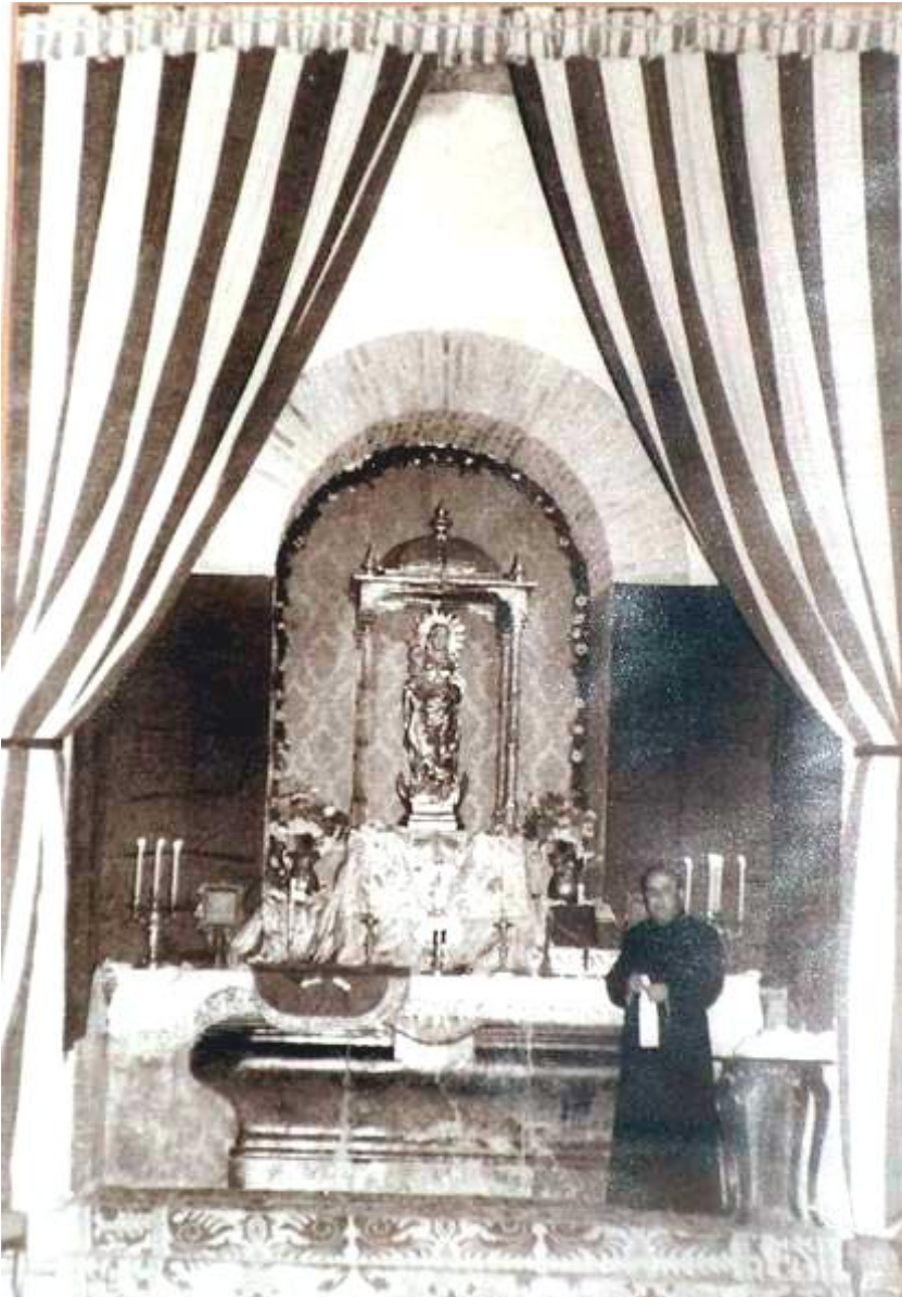
Fig. 1. Figura de la Virgen de Linares en la concavidad de la torre

mente para las caballerías. Por último, la espalda del Santuario deja ver bastantes claros de ventana y presenta, como construcción más simpática, las ojivas de colores del camarín y la carcomida mole del almenado torreón». (REDEL: 1910, 86)