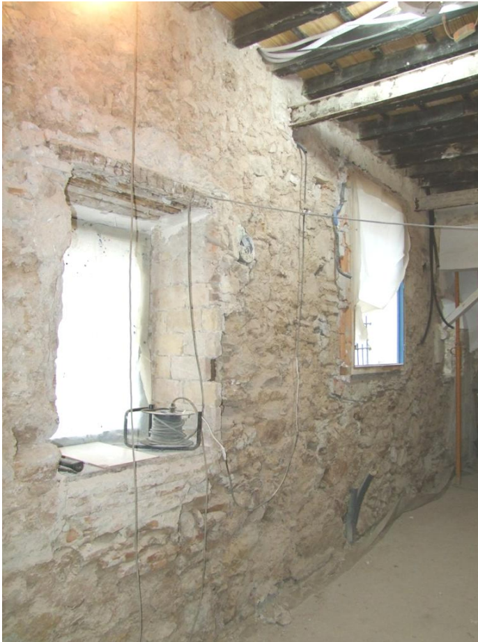
Fig. 12. Ampliación por el Sur del conjunto. Muro que cierra el espacio correspondiente al galerión

Esta fase corresponde con las fábricas de la parte trasera del conjunto y a la construcción del espacio perteneciente al antiguo «galerión» destinado a la casa del santero (ubicada hasta el momento en la zona del «salón bajo») (Fig. 12). Al final de la larga galería se construye la escalera, que daría acceso a la planta superior de este anexo, construido en este mismo momento, donde habría unas cocinas, comedor y una sala de reuniones del Cabildo Catedral (CÓRDOBA: 1805), y también al coro y planta superior del salón, levantado en la anterior fase.