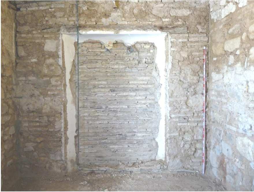
Fig. 10. Levantamiento de muro de partición de la sacristía, respectivamente