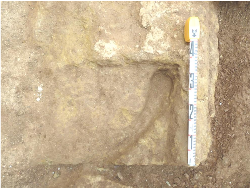
Figs. 3-4. Sillares correspondientes a la fábrica más antigua del conjunto y marca de los goznes en los sillares, respectivamente