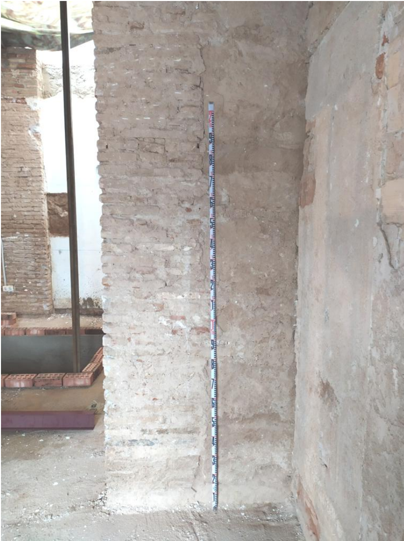
Fig. 11. Aparejo mudéjar del contrafuerte de ladrillo ubicado en el gran salón

La construcción del pórtico de cuatro vanos y el «salón bajo» y alto se planea según proyecto del arquitecto Gaspar de la Peña. Esta noticia es aportada por Rafael Aguilar, en un artículo en el Diario Córdoba de fecha 05/05/1962. En el mismo año de 1661 se llevaron a cabo reparaciones en los tejados de casa e iglesia (REDEL: 1910, 97).