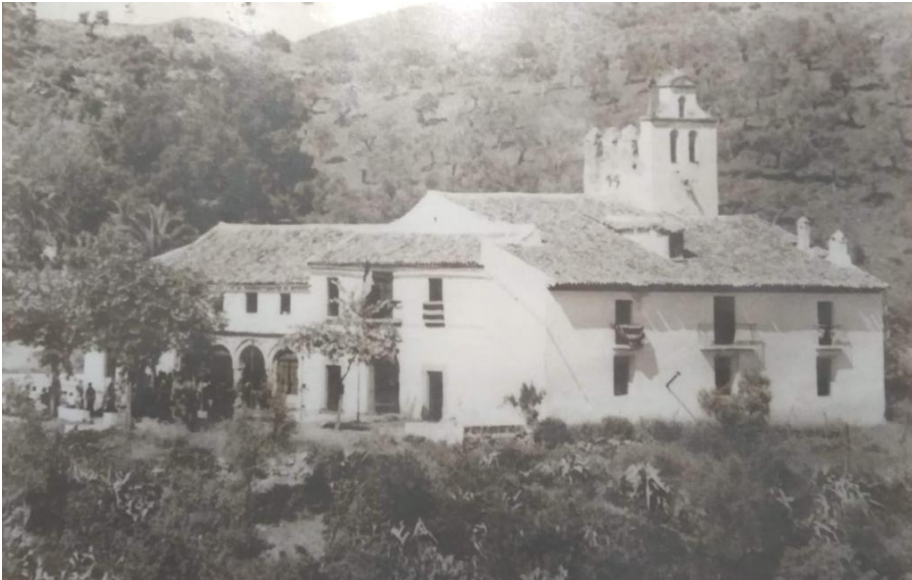
Fig. 2. Fotografía general del santuario. Años 1920-1950 aproximadamente

Por los documentos gráficos con los que contamos, a mediados del s. XX el santuario estaba formado por la ermita de tres naves con la torre a la que se añadía un cuerpo de dos plantas en forma de «U» alrededor de un patio central con cubierta a un agua en su fachada principal y a dos aguas en el resto. Detrás de las dos crujías de la fachada principal aparecía una edificación de una planta con cubierta un poco más elevada tal como se puede apreciar por la diferente altura entre el dintel de los huecos y la cornisa de acuerdo con lo que se observa en las fotos antiguas y en las actuales (Fig. 2).