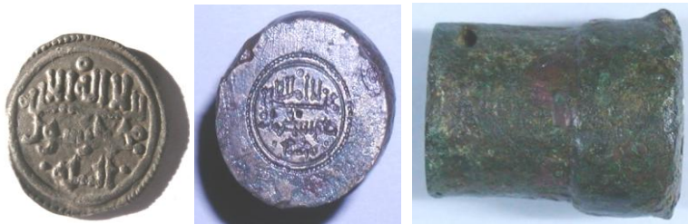
Fig. 12 (1) Quirate / (2) cuño para su fabricación. MACO ref. 4557

Conocemos cómo eran los cuños para la fabricación de quirates por la existencia de una de estas piezas en el MACO, la cual ingresó en el Museo en diciembre de 1926 por compra a D. Emilio Pinilla (Fig. 12-2). Se trata de la parte dedicada a la grabación del área que lleva la inscripción de la Profesión de Fe y la (Risala) Misión profética de Mahoma; valga a modo de ejemplo la primera área de un quirate de `Ali ben Yūsuf (Ref. V. 1535) acuñado según el modelo del cuño (Fig. 12-1).