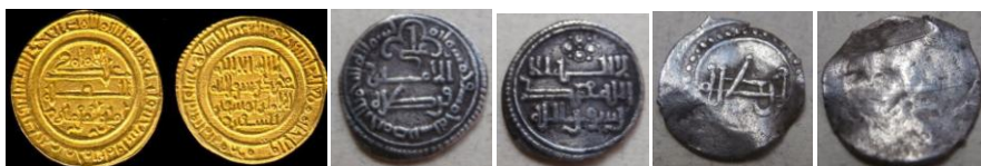
Fig. 11. Monedas almorávides (1) Dinar M. Córdoba 495 H., 24 mm. 4,96 grs. (Col. Tonegawa) (2) Quirate ref. V.1670 505 H. 13,5 mm. 0,8 grs./ (3) ½ quirate mm.

A partir del 462 H. desaparece la taifa de Córdoba al pasar a depender de Sevilla primero (462 – 467 H.), luego de Toledo (467 – 471 H.) y nuevamente de Sevilla hasta su incorporación al imperio Almorávide en (484 H.) 27 de marzo de 1091. Durante el periodo almorávide se introducen nuevos modelos de monedas, el dinar o «morabetino» para el oro (Fig. 11-1) y el quirate con sus divisores para las monedas de plata (Figs. 11-12 y 3); en ellas, cuando se refiere a la ceca, encontramos el nombre de las ciudades de acuñación, en nuestro caso «Córdoba».