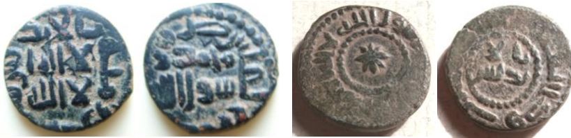
Fig. 6. Feluses de al-Andalus 33

En plata se acuñaron dírhamms de un peso de 2,95 grs. y una ley alrededor del 98 %, y fueron fabricados entre los años 104 -136 H. (722 – 753 d.C.), (Fig. 5-2). En cobre los feluses de un peso irregular dado su escaso valor, (1/60 del valor del dírham), los cuales se caracterizan por su grueso cospel y un trazado en sus inscripciones de letras anchas; en su mayoría solo llevan las clásicas inscripciones religiosas y en algunos casos se incluye la ceca de al-Andalus y a veces la fecha 92 – 108 y 110 H. (Figs. 6-1 y 2). Excepto los feluses, las monedas de este periodo son muy escasas.