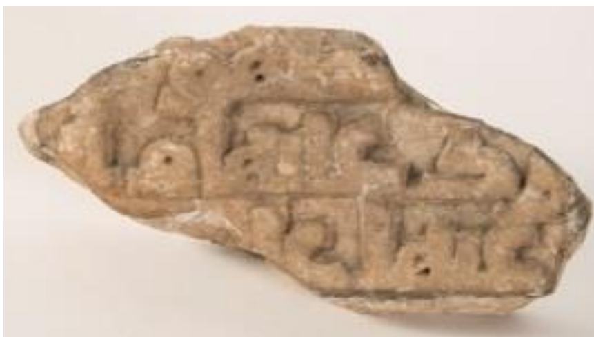
Fig. 18. MAN ref. Fa50390-ID001.

Al realizar la ampliación el edificio hacia poniente apareció «un crecido número de objetos que fueron cedidos al Museo Arqueológico Nacional en 1867 por el obispo D. Juan Alonso de Alburquerque». Según las fichas del MAN, se trata de 33 objetos consistentes en fragmentos de capitel, de basas, canecillos, impostas y restos de decoración, todos ellos catalogados como pertenecientes a los periodos visigodos y musulmán. Un detallado estudio y descripción de estas piezas ha sido realizado por Alberto Montejo en su trabajo sobre la Rawda del Alcázar de Córdoba 41 . Con inscripción hay un fragmento de lápida sepulcral que por sus características y situación del hallazgo, pertenecería a la rawda califal, en la que se lee «...sobre ella...con ella...» (Fig. 18).