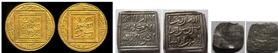
Fig. 13 Acuñaciones almohades de ceca Córdoba: (1) ½ dinar 19 mm. 2,28 grs. (Col. Tonegawa) (2) dirham ref. V.2092 13,5 mm. 1,5 grs. (3) ¼ de dirham 8 mm. 0,2 grs.

datado de época almorávide 37 . Sobre la situación de la ceca de «Córdoba» de este periodo no tenemos datos, conocemos sus acuñaciones en oro (doblas) (Fig. 13-1) y en plata (dírhams y sus divisores) (Fig. 13-2 y 3).