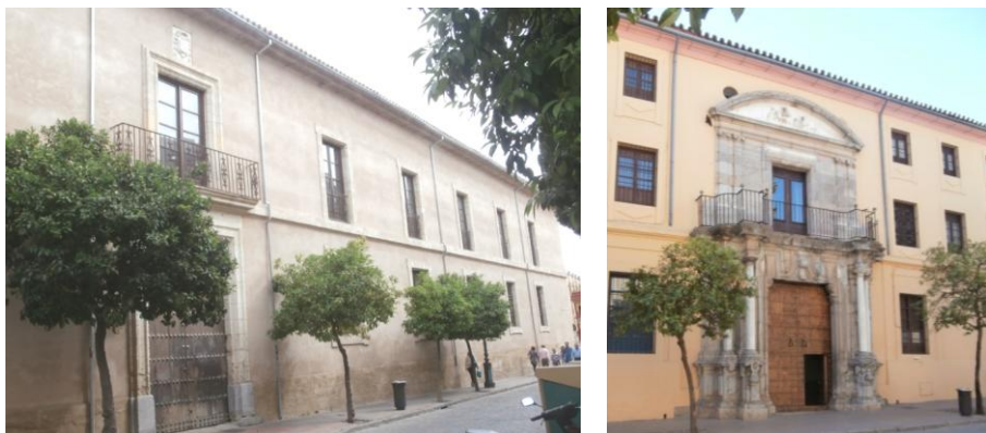
Fig. 21: (1) Fachada de la biblioteca (Fig.16-8 Obispado) y (2) Seminario, áreas de (Figs. 17-3 y 4)

El palacio episcopal se quemó en 1745, afectando tanto al edificio como al archivo eclesiástico, y se inició una rápida reconstrucción. Respecto a la biblioteca se tuvo en cuenta que tras la expulsión de los jesuitas, sus bibliotecas se trasladaron a los obispados y se depositaron en los fondos del palacio episcopal, por lo que hubo que crear espacios para ellos encargándose del proyecto Ventura Rodríguez en el año 1772 (Fig. 21-1). El terreno debía estar paralelo a la fachada N. del Seminario de San Pelagio y a la fachada S. del palacio episcopal creando una crujía que iría desde la puerta principal del palacio que abre a la Calle Torrijos hasta la n.º 2 de la calle Amador de los Ríos 47 (Fig. 17-7) y (Fig. 21).