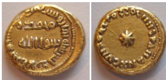
Fig. 4. Dinar de al-Andalus del año 98 H.

En el año 98 H. (716 d.C.), durante el gobierno del wālī al-Ḥurr los dinares pasan a ser bilingües y en ellos sigue figurando en el área escrita en caracteres latinos que se había acuñado en Spania, y en el reverso, con escritura cúfica en el centro, aparece escrita la (Risala) Misión profética de Mahoma, y en la orla «Fue acuñado este dinar en al-Andalus el año 8 y 90» (Fig.4).