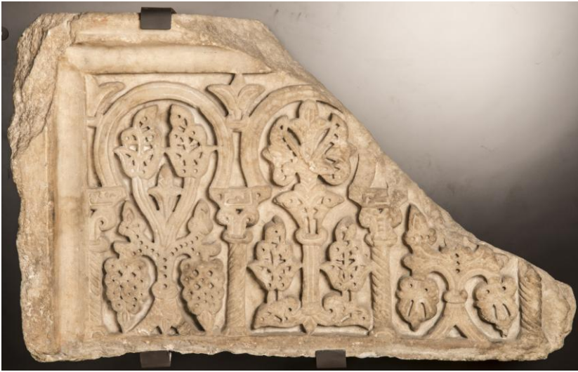
Fig. 19. Lastra de mármol MAN 50369.

se apoyan en capiteles y columnas y en los cimacios. A la pieza le falta una esquina con su decoración, no obstante hay dudas sobre la procedencia de esta pieza al indicar solo su procedencia como «Córdoba» en lugar del «Alcázar de Córdoba». Según la ficha del MAN hay una inscripción alusiva al autor de la obra: ( Amal ) /Ṭar/ īf/ abhidi – Obra de Ṭarīf su siervo 42 .