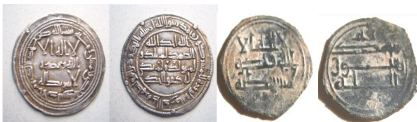
Fig. 7. (1) Dirham ref.151.1 151 H. 26 mm. 2,8 grs. / (2) Felus ref.I-48 18 mm. 1gr.

El contenido en plata de la moneda emiral está alrededor del 90%. Los feluses de esta etapa reducen su espesor, aumentan su módulo y su epigrafía es de líneas más fina, siendo pocas las monedas en las que aparece la ceca y la fecha (Fig. 7-2).