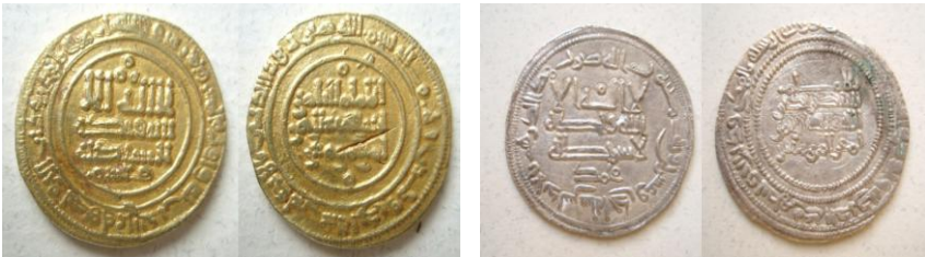
Fig. 9. Monedas de al-Andalus:

A partir del año 316 H. (928 d.C.), y durante todo el periodo califal, se vuelve a acuñar moneda de plata y de oro en la ceca de al-Andalus (fig. 9-1 y 2) con la excepción de los años 336 al 365 H., en los que se traslada la ceca a Madīnat al-Zahrā' 34 .