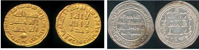
Fig. 5. Ceca al-Andalus:

(1) Dinar 102 H. 15 mm. 2,16 grs. // (2) Dirham 106 H. 26 mm. 2,86 grs. (Col. Tonegawa)