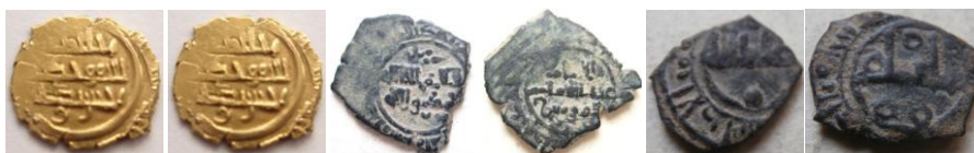
Fig. 10. (1) Fracción de dinar ref. BY8 44(x) H. 0,7 grs. 10 mm. (2) Fracción de dirham ref. BY4 1,7 grs./15 mm. ceca Córdoba (3) Fracción de dirham ref. BY12 ceca Al-A(n)dalus

En el caso de la taifa de Córdoba, y entre los años 422 y 462 H. (1031 y 1070 d.C.), los Banū Ŷahwar acuñaron pequeñas monedas de oro (Fig. 10-1) que fueron perdiendo calidad al aliarse con los Banū Birzal de Carmona (Fig. 10-2). Sus acuñaciones están realizadas en Córdoba 35 encontrando algunas monedas atribuidas a esta serie con la ceca de al-Andalus, (así, en el ejemplo adjunto vemos la ceca escrita en la forma al-A(n)dalus Fig. 10-3/1 a ). De este periodo no tenemos referencias sobre la situación de la ceca en Córdoba.