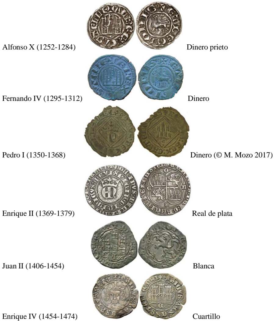
Fig. 15 Acuñaciones de la ceca de Córdoba a partir del 1236

Las fuentes citan la existencia de una casa de la Moneda de Córdoba, aunque pese a dichas fuentes resulta difícil su localización. Por ello hemos procedido a recogerlas y estudiarlas y, a través de ellas, deducir su ubicación. Las fuentes son las siguientes: