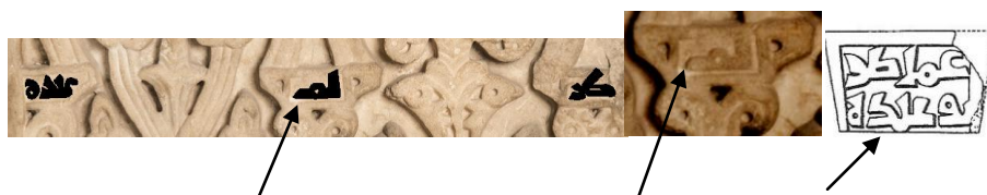
Fig. 20. 1ª Inscripción de la lastra del MAN remarcando la inscripción 44 , 2º Detalle de la inscripción de la lastra, 3ª Cartela de capitel de M. al-Zahrā' 45

La diferencia de interpretación proviene fundamentalmente por la lectura de la letra mīm (m) de la lastra, interpretándola como una letra fā' (f) las cuales son parecidas y se diferencian en la posición de la circunferencia que lleva la composición esculpida del trazado de la letra, si está pegada a la base es una m , y si está elevada y separada de la base es una f . La diferencia la observamos en los detalles de figs. 20 - 1º, 2º y 3º.