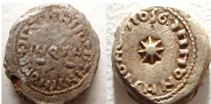
Fig. 3. Dinar 13 mm. 4,3 grs. IND XII / 95 H. / 714 d.C.

Vamos a hacer una breve presentación de la secuencia de acuñaciones realizadas en la ceca de al-Andalus – Córdoba. Existen amplios tratados que desarrollan este tema 30 , por lo que solamente expondremos los ejemplos característicos de cada momento histórico. Lo iniciamos con los primeros sólidos (dinares) de Hispania con escritura latina, los cuales se acuñaron entre los años 93 y 95 H. (712 – 714 dC.) siendo gobernador de Ifriquilla e Hispania Mūsà ben Nušair (Fig.3). Se caracterizan por llevar leyendas con letras exclusivamente latinas, aunque ya incluían la primera parte de la Profesión de Fe islámica. En el centro de una de sus áreas figura una estrella, que es el símbolo del planeta Espero o lucero de Poniente por el que los griegos llamaban Hesperia a la península Ibérica, y marca la diferencia con las acuñaciones norteafricanas 31 . Se fabricaron probablemente en Sevilla, en talleres móviles, durante la campaña de ocupación utilizando como material el botín recogido, lo que dio lugar a grabados toscos y ley irregular. También se acuñaron 1/2 y 1/3 de dinar llamados semises y tremises.