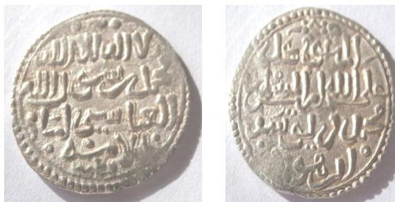
Fig. 14. Dirham ref. V.2143 17 mm. 1,6 grs., acuñado en Córdoba por Mutawakil ibn Hūd

Las últimas acuñaciones musulmanas de Córdoba se realizaron a nombre de Mutawakil ibn Hūd (Fig. 14), y a partir del 1236 la ciudad pasa a ser controlada por Fernando III.