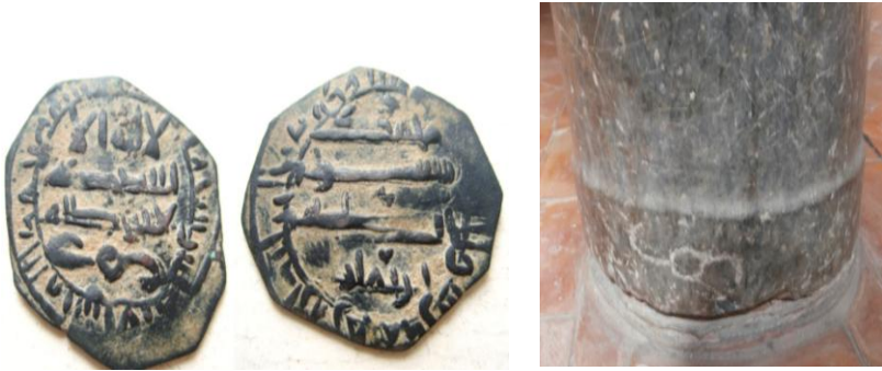
Fig. 8. Felus ref. I-87 año 30(x) H. 20 mm. 1,9 grs. y fuste de columna

Almanzor 2º fuste de la fila de columnas entre las capillas 41y 42). Además en su cimacio aparece grabado el principio de la P.F. y la M.P.