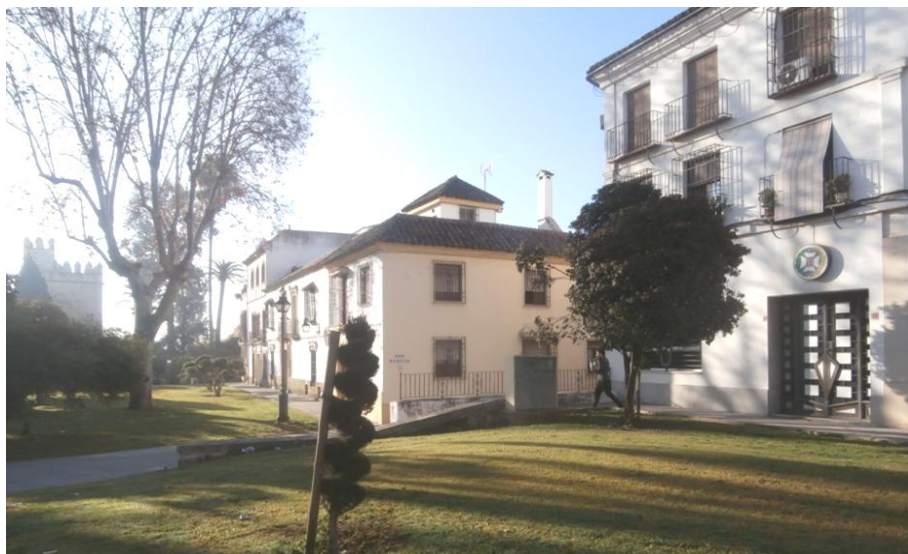
Fig. 1. Plaza de los Santos Mártires y entrada a San Basilio

En esta zona tenemos la noticia del hallazgo de unos crisoles en el flanco occidental del Campo o Plaza de los Santos Mártires, en el solar de la casa n.º 2 de la moderna calle de San Basilio, sede del Colegio Oficial de Enfermería, espacio que estaría frontero al exterior de la muralla (Fig. 1). En este lugar, al hacer la excavación del actual edificio, aparecieron restos de una pila, muros musulmanes y tres crisoles de cerámica para la fundición de metales. En ellos se hizo un análisis por la empresa AMPCOR SL raspando el material de las paredes internas en las que se observan sales de cobre, y el polvo resultante fue sometido a un análisis de copelación dando como resultado la presencia de plata, mientras en el de menor tamaño se han encontrado indicios de haber sido utilizado para fundir oro (Fig. 2).