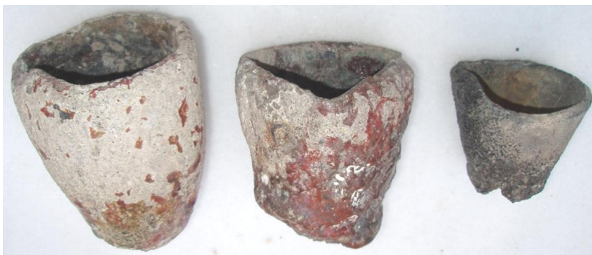
Fig. 2. Crisoles encontrados en San Basilio

Durante las excavaciones arqueológicas realizadas en la zona del Alcázar y la Plaza de los Santos Mártires 27 no se han obtenido datos suficientes para definir con seguridad el lugar donde estuvo ubicada la ceca: «se han detectado una serie de estancias con sus muros y pavimentos que indican que todo ello estaba construido... con zócalos rojos como en Madīnat al Zahrā'...» 28 . Y en cuanto a monedas en la zona, solamente conocemos el hallazgo de un dirham del año 166 H. durante las excavaciones iniciadas en el año 2002 en el patio de Mujeres del Alcázar, y una moneda de cobre árabe al hacer los cimientos de la ampliación del seminario de San Pelagio hacia el Campo de los Santos Mártires en el año 1897 29 .