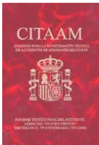
Informe Técnico Final de la CITAAM

Las condiciones de la tripulación, no dudando de su experiencia profesional, pero contemplando su historial de accidentes y las condiciones psicofísicas tras su intensa vida social en Cuba.