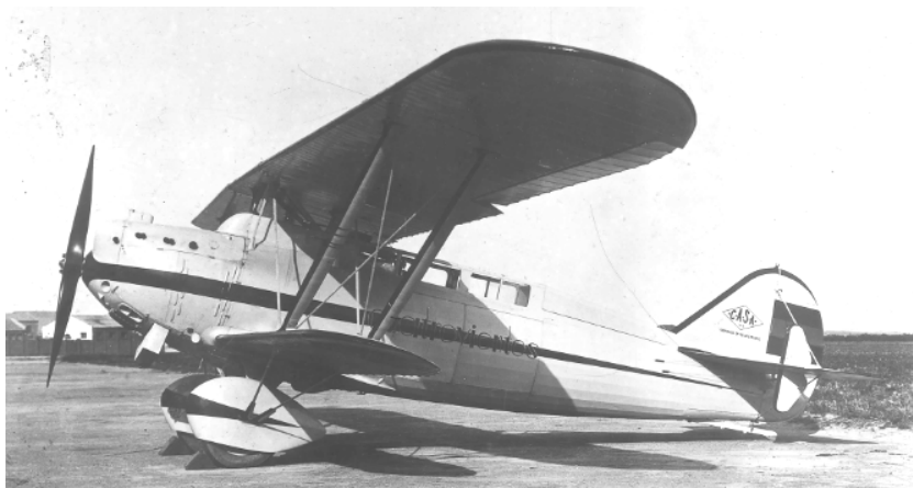
El avión Breguet XIX GR Superbidón «Cuatro Vientos»

cuatro meses y medio trabajando en dos turnos, de día y de noche. Recibió su nombre en honor al aeropuerto militar de Madrid y de la Escuela de Aviación, de la que era director Barberán, de esa denominación y su coste fue de 80.000 pesetas.