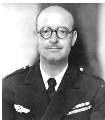
Capitán Mariano Barberán

En octubre de 1932 presentó al Gobierno el proyecto de la aventura. Él sería el navegante y director. Eligió como piloto a un joven teniente, Joaquín Collar, y como mecánico al sargento Modesto Madariaga. El vuelo se realizaría en un sesquiplano Breguet XIX, Superbidón. El Presidente de Gobierno, Manuel Azaña —que no era precisamente un entusiasta de los gastos en aeronáutica— aceptó la propuesta y se asumirían los costes de la misma, pero con la condición de que el avión fuese construido totalmente en España, como se puntualizó taxativamente: «Hasta el último tornillo».