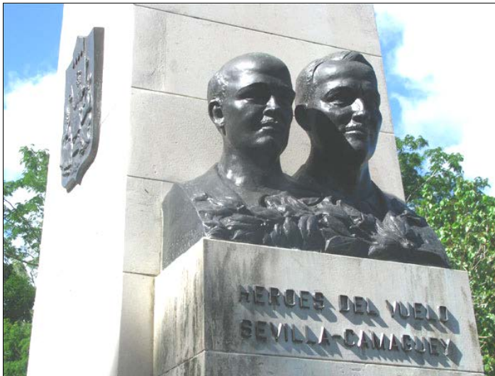
Los héroes Barberán y Collar