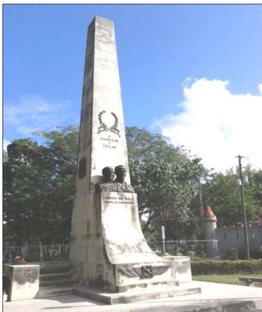
Monumento a Barberán y Collar en Camagüey (Cuba)

La ciudad camagüeyana siguió recordando la gesta y en el cincuenta aniversario, en 1983, se develó una tarja en la terminal del aeropuerto Ignacio Agramonte. En el sesenta aniversario, en 1993, se colocó una placa en la fachada de la que fue sede de la Colonia Española, en la calle Cisneros haciendo referencia al recibimiento que allí tuvieron los aviadores españoles. En el 2008, celebrando el 75 aniversario, se colocó una placa conmemorativa, sobre una base de obra, en la delantera del obelisco del Casino Campestre recordando esta efeméride.