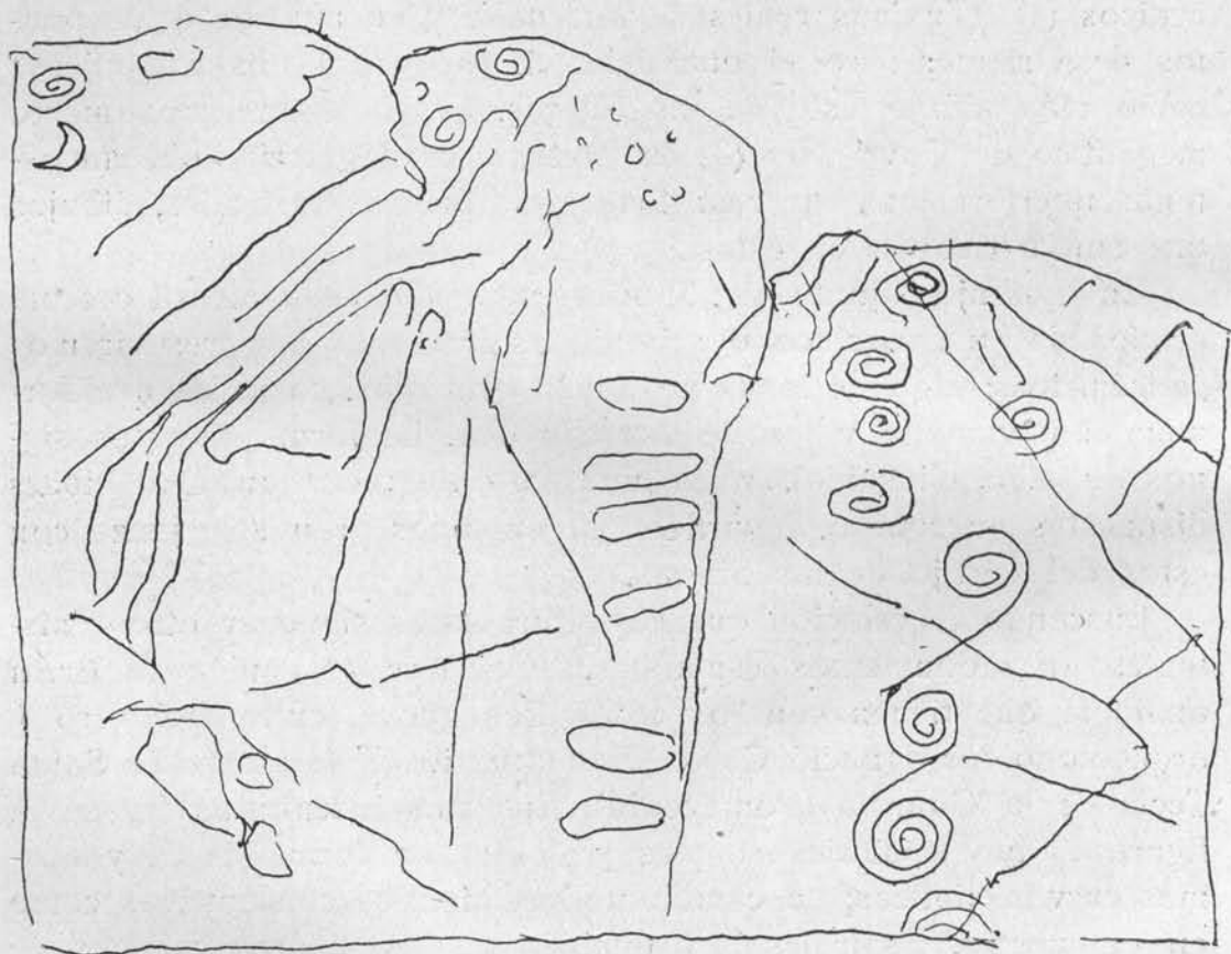
SIGNOS DEL MONTE DE SANTA TECLA, Fig. 2.

Sin pretender afirmar nada que niegue tan autorizadas opinio-