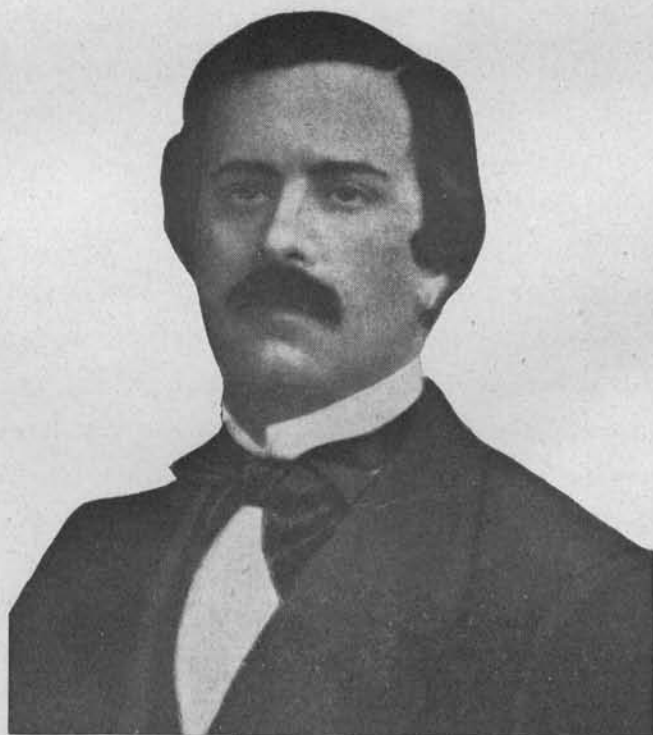
D. JUAN VALERA

el insigne autor de «Pepita Jiménez», en su juventud.