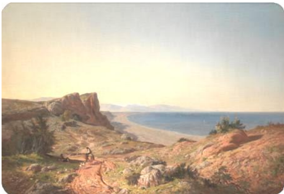
Carlos de Haes: Un paisaje. Recuerdos de Andalucía: La costa mediterránea cerca de Torremolinos .