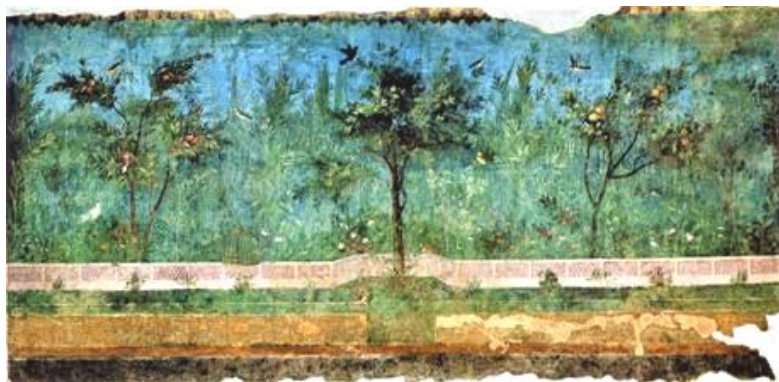
Jardín de Livia. Roma.

tempranas de la historia la protección del paisaje como una visión bella de la naturaleza que uno puede contemplar ha recibido protección jurídica.