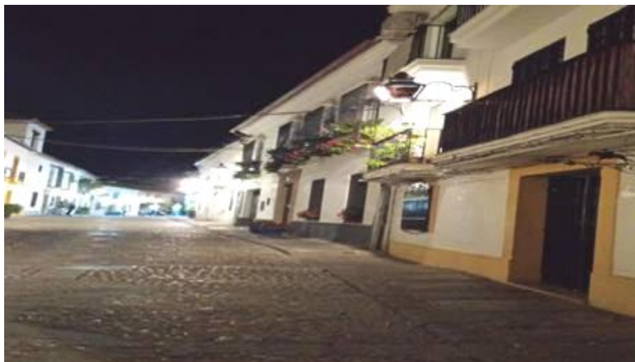
Calle de Córdoba.

A menudo, cuando hablamos de protección del paisaje tanto rústico como urbano, estamos pensando en los espacios de excepcional belleza; pero no sólo son los bienes de valor excepcional los que merecen protección. Es más, espacios urbanos y rústicos como el que conforma la Mezquita de Córdoba, o Doñana o Covadonga ya cuentan con adecuada protección. Corren actualmente mayor riesgo los espacios rústicos y urbanos normales, pero cargados de autenticidad, que llevan en su ser la mano del hombre, que forman nuestra memoria histórica, y son nuestra identidad cultural.