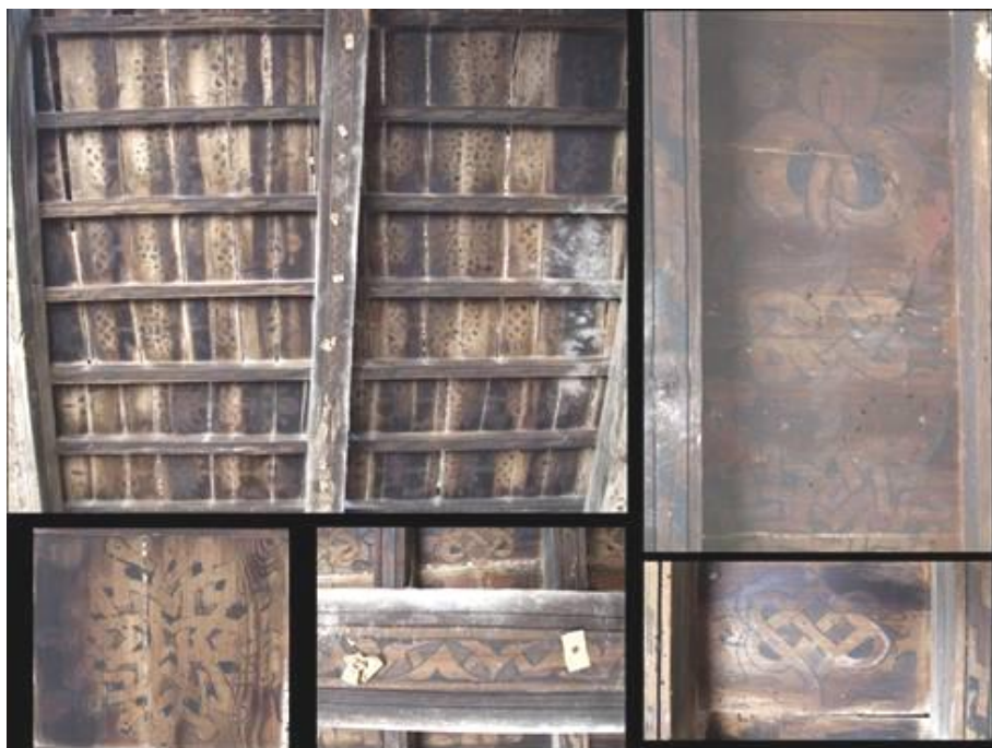
Lám. 7. Detalles varios de los motivos decorativos del alfarje

Las calles que se generan entre las jácenas miden 88 cm. excepto en los laterales, siendo la del este de 1.07 m. y de 79 cm. la del oeste y sus alfarzones oscilan entre 21 y 23 cm. Todas estas calles están decoradas con una secuencia de motivos decorativos que se repiten de forma continua a lo largo de todo el alfarje, es decir, hasta 10 veces aparece esta secuencia entre jácenas, lo que hace un total de 80 repeticiones en toda la superficie. Desgraciadamente no hemos documentado ningún escudo nobiliario que nos permita aquilatar la propiedad ni la cronología.