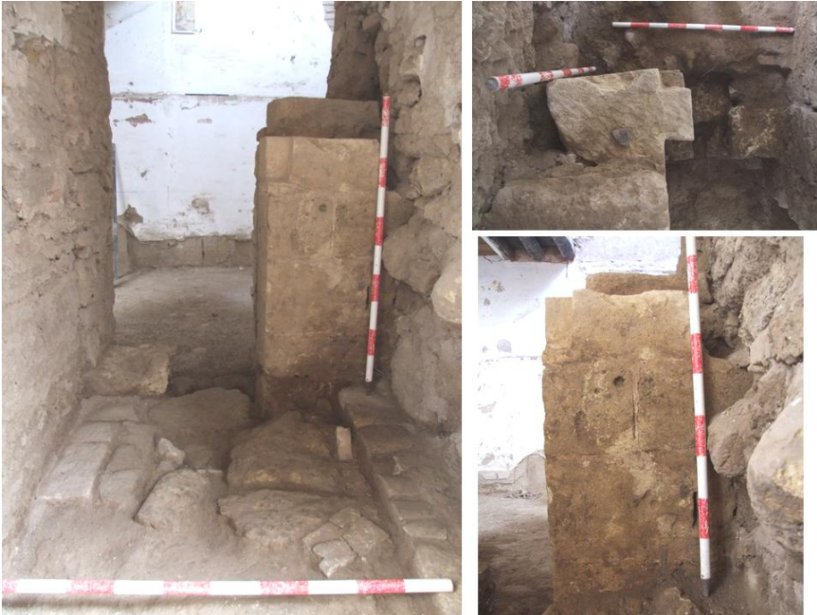
Lám. 4. Jamba de sillería amortizada en el cuerpo de escaleras. Vista cenital de la moche- ta labrada en la sillería. Detalle de la fábrica

podemos asignar dos funciones. La primera función sería como sustentante de decoración en yeso y la segunda función la de formar parte de la propia decoración a modo de arranque de un alfiz en sillería. La rica fábrica conservada guarda similitud con la primera puerta de acceso al pórtico. Este hallazgo prolongaba el patio hacia el oeste y un testigo de pavimento asociado a esta portada de sillería deja constancia de que la pavimentación del patio era de lajas de piedra de calcarenita. El patio disponía de un pozo (parcialmente documentado) que quedó amortizado en la etapa moderna.