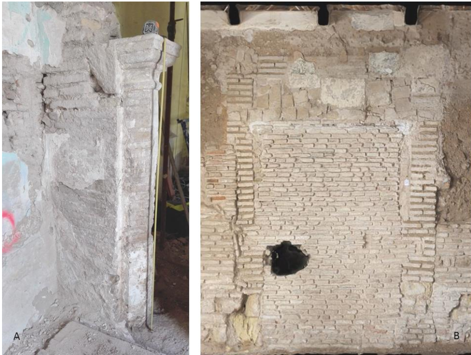
Lám. 6. Arcada mudéjar sur. Vista desde el norte de la portada de la arcada norte

aprox. La arcada norte, en cambio, tiene una distancia de pilar a pilar de 6.70 m, lo que le confiere mayor longitud. El pilar este de la arcada sur quedó frente por frente al de la arcada norte, pero el pilar opuesto quedó enfrentado a la altura de la columna oeste. Desconocemos si la arcada se articuló con dos o tres arcos y apoyados en columnas ochavadas de ladrillo, pero los laterales sí fueron medias columnas adosadas a los pilares de cierre. El haber encontrado piezas de ladrillos labrados que nos recuerdan a los remates en gola de los alfices de la arcada norte, nos lleva a pensar que los arcos se enmarcaron por alfices. En esta fase el espacio 3 o patio quedaría delimitado al sur por esta crujía que la identificamos con el espacio 5 medieval. Este espacio quedaba cerrado al sur con un muro mixto del que no se ha excavado la zanja de cimentación, por lo que su adscripción cronológica es por paralelos tipológicos y relaciones estratigráficas. En esta fábrica aparece el arranque de un vano que se correspondería con el arco central de esta arcada.