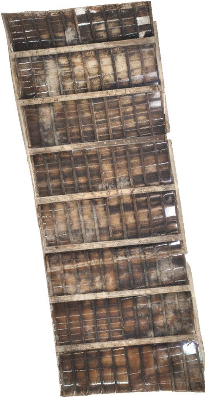
Lám. 8. Fotogrametría del alfarje de Pintor Bermejo (José María Tamajón)