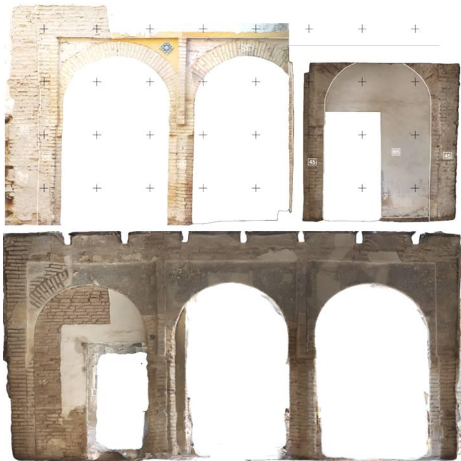
Lám. 5. Arcada mudéjar norte. Vista desde el sur (arriba) y desde el norte o al interior (abajo).

lastras achaflanadas y adosadas a los muros laterales. Tiene una distancia de lado a lado de 6.70 m. Los alfiles quedan decorados o rematados en la zona inferior con motivo ondulado o gola. Los capiteles quedan esbozados en los ladrillos representados con la talla de un pequeño mocárabe 7 , cuña o cuarto de esfera, aunque con incisión al centro. Todo se labra con la misma fábrica en ladrillos macizos color pajizo trabados con mortero de cal y arena de color grisáceo amarronado, con nódulos de cal y con un