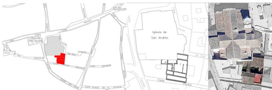
Lám. 1. Localización del solar y relación del inmueble con la parroquia de San Andrés

lógico del Plan General de Ordenación Urbana de 2001. Además se ubica en el entorno más inmediato a un B.I.C., la iglesia de San Andrés (Lám. 1).