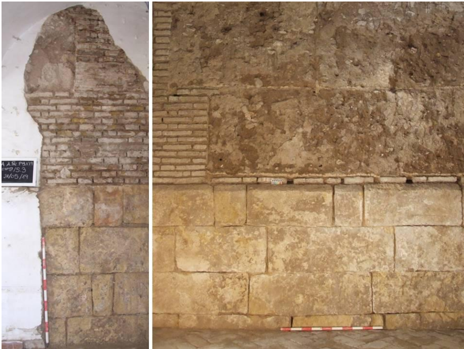
Lám. 3. Despieces de los muros del templo, documentados en los espacios 17 y 20

escuadra o en «L» y recorren unas dimensiones de 11 m aproximadamente de este a oeste y unos 3.5 m de norte a sur. La estructura en su zona inferior consta de un potente zócalo de sillería de calcarenitas con sus unidades bien escuadradas. Se documenta 1.69 m de altura y al menos 4 hiladas. La fábrica se presenta con dos tipos de despieces, bien alternan 1 soga por 1 tizón (la 1ª y 4ª hiladas) o bien se disponen sogas (2ª y 3ª). Esta alternancia se ha documentado en el espacio 20 de la casa, mientras que en el resto de espacios, el despiece continúa la alternancia de sogas y tizones. Respecto a las medidas de las hiladas se documentan: 1ª hilada 41 cm, 2ª 44 cm, 3ª hilada 41 cm, 4ª 40 cm; las sogas oscilan entre 90 y 99 cm y los tizones entre 29 y 34 cm. En la parte superior presenta un elemento muy descriptivo, un chaflán de 10 cm labrado en la piedra, de lo que se deduce que estos espacios inmediatos estuvieron a cielo abierto, pues su función no es otra que escurrir las aguas pluviales.