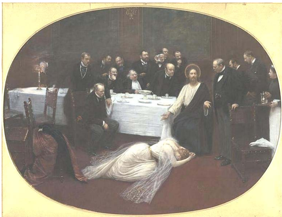
Jean Béraud, La Madaleine chez le Pharisien (1891), Musée d'Orsay