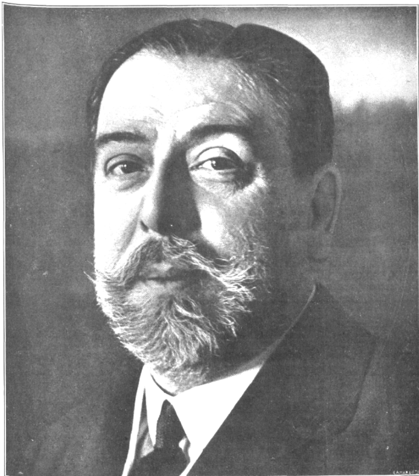
D. JULIO BURELL Ilustre periodista y ex ministro liberal, que ha fallecido el día 21 del corriente

UNA GRAN FIGURA DEL PERIODISMO, QUE DESAPARECE