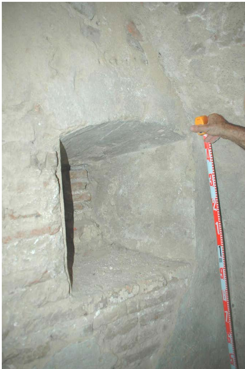
5. Tronera bajomedieval en el interior de la torre de Nuestra Señora del Castillo y que en su día formó parte de la casa-fuerte del comendador.

da, cuyos pozos y aljibes hemos podido ver tanto bajo la parroquia como en el convento aledaño, o la tronera que, en el transcurso de nuestros trabajos, pudimos documentar dentro de la torre de la iglesia y cuyas características apuntan al siglo XV.