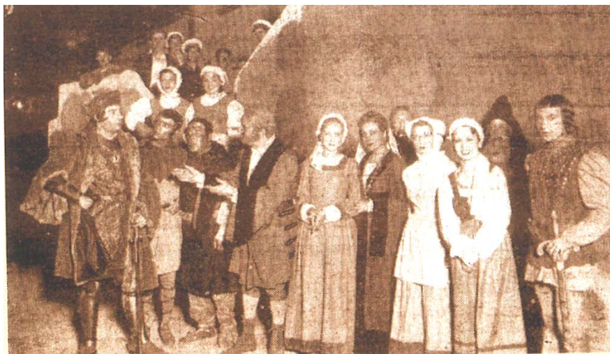
7. Cuadro de actores de la compañía de teatro Xirgú-Borrás, representación de 1935.

El resto del B.I.C. lo conforman las cuatro calles principales de Fuente Obejuna que se citan en el documento de la toma de posesión de la villa, y que tanta significación tuvieron en su puesta en escena cuando la localidad pasaba a manos de Córdoba. A saber: las calles Maestra, Corredera, Santo y la calle Córdoba, lugar predilecto de residencia de nobles y señores principales.