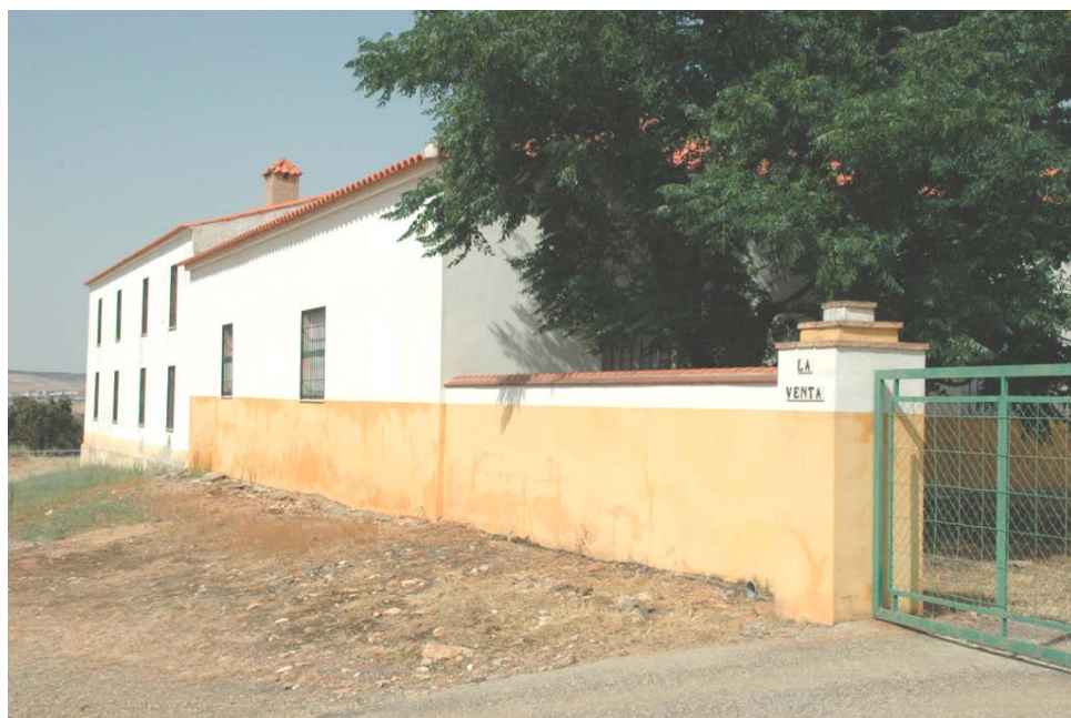
3. Cortijo de la Venta, antaño al pie del antiguo camino Real de Córdoba a Fuenteovejuna (cordel de Córdoba).