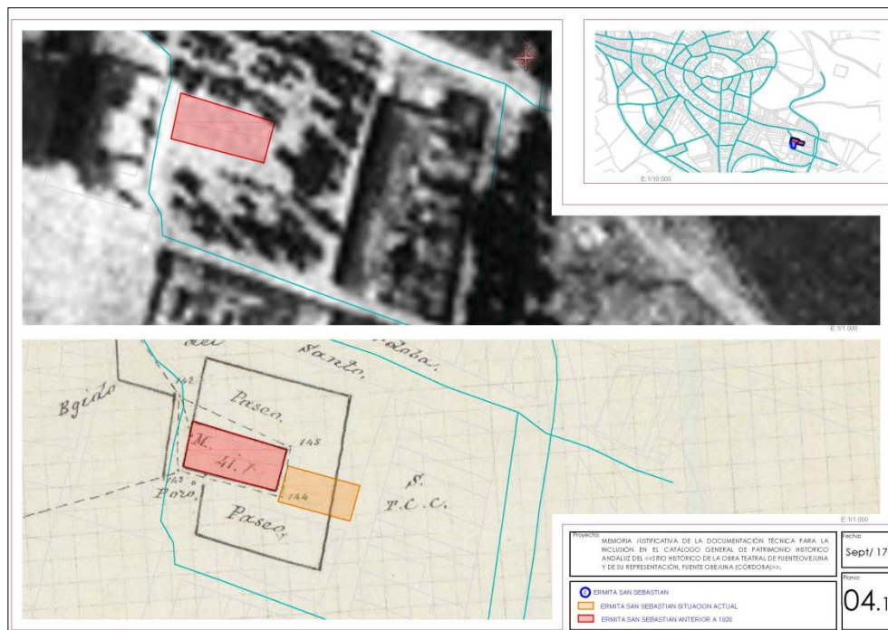
6. Arriba, a la izquierda, ortofoto del vuelo del 56 con superposición de la planta original de la antigua ermita de San Sebastián.

También Alfonso de Palencia, al relatar los sucesos, afirma que el pueblo no permitió dar sepultura al cadáver “a un religioso del monasterio de San Francisco, fundación del comendador”; sin embargo, pensamos que debe tratarse de un error, ya que en la fecha de la sublevación (1476) aún no se habían establecido los franciscanos en Fuente Obejuna, siendo 1520 el año de fundación del primer convento de la Orden en la localidad, en un paraje extramuros conocido como “Huerta del Fraile”, donde estuvo hasta que en 1594 se trasladó a su actual emplazamiento en el interior de la villa.